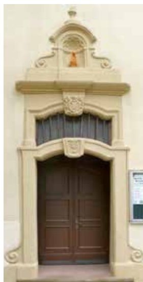
Foto: Eingang Lourdes-Kapelle

Immer wieder hört man von Vandalismusschäden in Kirchen. Aus diesem Grund ist die Pfarrkirche Wadern ab dem 01.08.18 geschlossen (durch Vandalismus entstandene Schäden werden von den Versicherungen nicht beglichen). Zum Beten und Verweilen ist die Lourdes-Kapelle (Eingang rechts vom Hauptportal, siehe Foto) der Pfarrkirche aber weiterhin geöffnet. Außerdem kann man durch die Gittertür den ganzen Chorraum sehen. Hier soll eine Kniebank aufgestellt werden, damit man auch hier die Möglichkeit zur Anbetung hat. Der Besuch der Kirche für Gruppen ist nach Vereinbarung weiterhin möglich. Bitte dafür mit dem Pfarrbüro in Verbindung setzen.